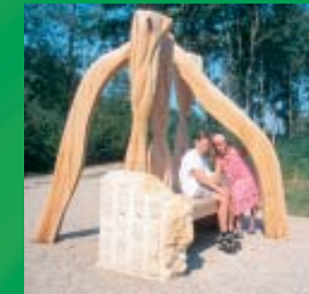
Höhlen-Bank (Stalagmit trifft Stalaktit)

Allen Künstlern wurden dabei folgende Rahmenbedingungen vorgegeben: Die verwendeten Materialien müssen aus Holz, Metall oder Stein sein. Materialien, die schon immer eine große Bedeutung für den Ort haben.