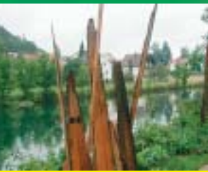
Beispiele von wechselnden Skulpturen