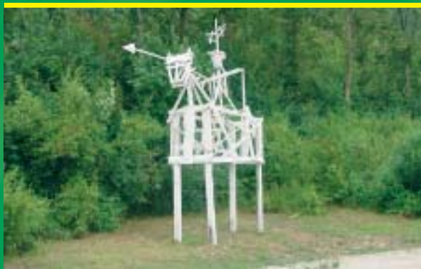
Kunst aus Restholz: Wegelagerer und Ritter

Informationen erteilt das Fremdenverkehrsamt Essing: