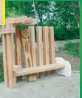
Narrenhäusl-Bank (Ein käfigartiges Gelass zur marktlichen Rechtspflege)

Die Bänke bilden somit eine ausgezeichnete Symbiose von Kunst, Geschichte und Nutzwert.